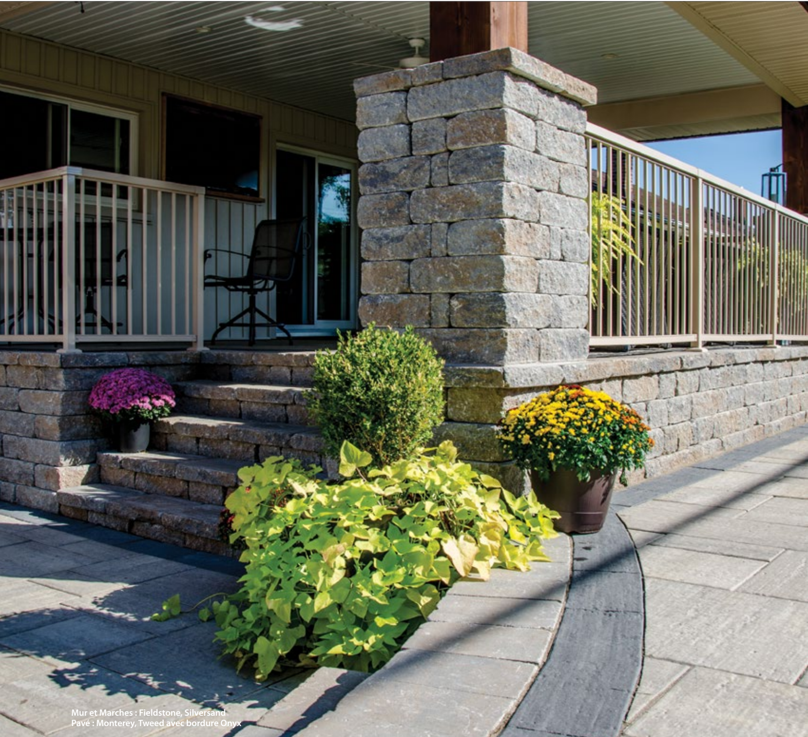
Mur et Marches : Fieldstone, Silversand Pavé : Monterey, Tweed avec bordure Onyx

Coupés grossièrement et construits solidement, les produits Fieldstone peuvent être installés selon des motifs aléatoires ou structurés, afin d'améliorer de manière créative des éléments de jardin comme des murs, des jardinières, des marches et des piliers d'entrée. Les unités préfabriquées sont disponibles en hauteur de 135 mm (5,31 po), avec un bord de retenue intégré à l'arrière pour une meilleure stabilité.